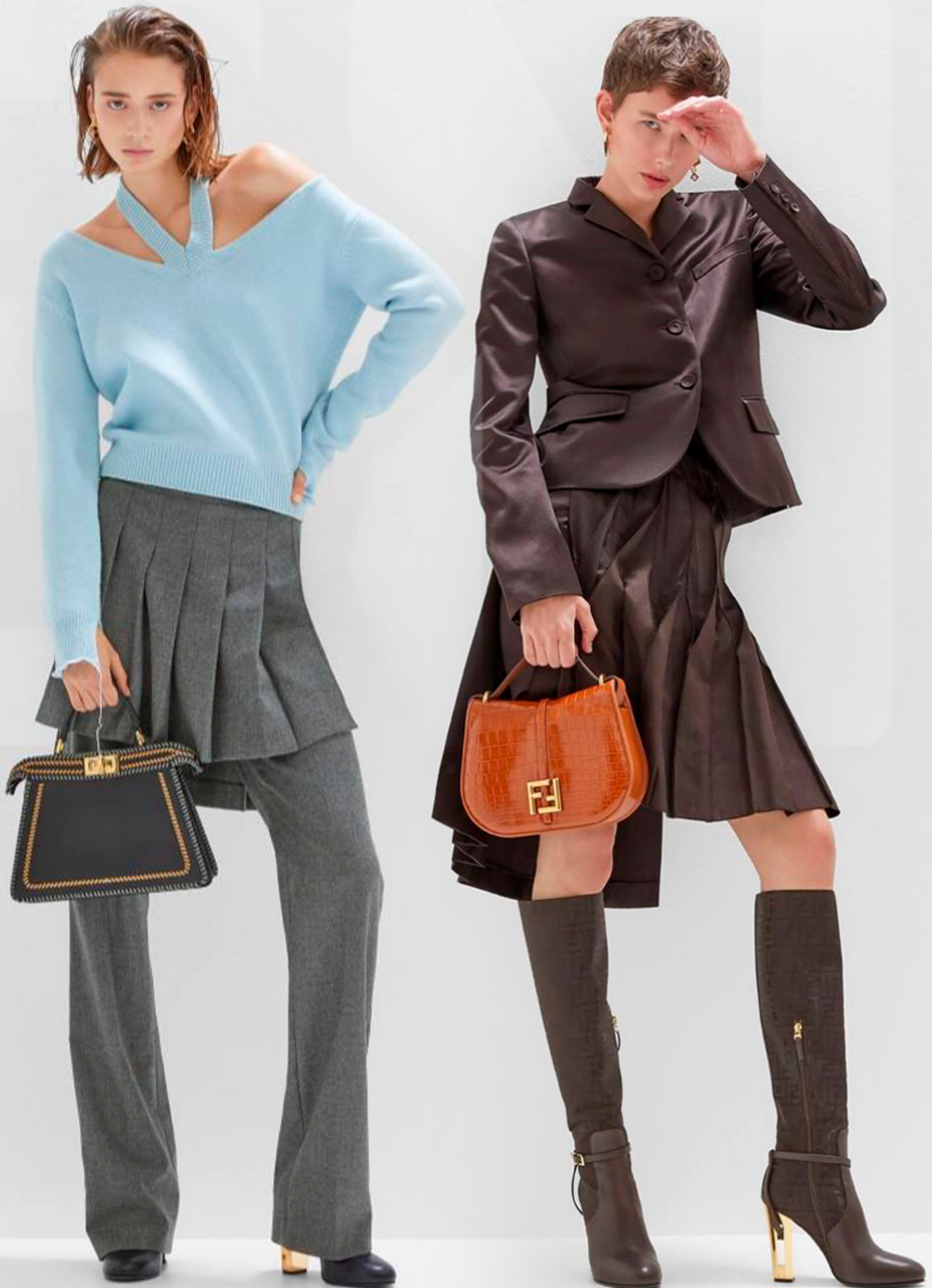
Туфли 818443 NA7 f0QA1